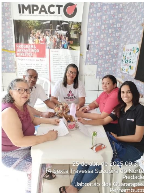
25 de abr. de 2025 09:31 14 Sexta Travessa Sucupira do Norte Piedade Jaboatão dos Guararapes Pernambuco