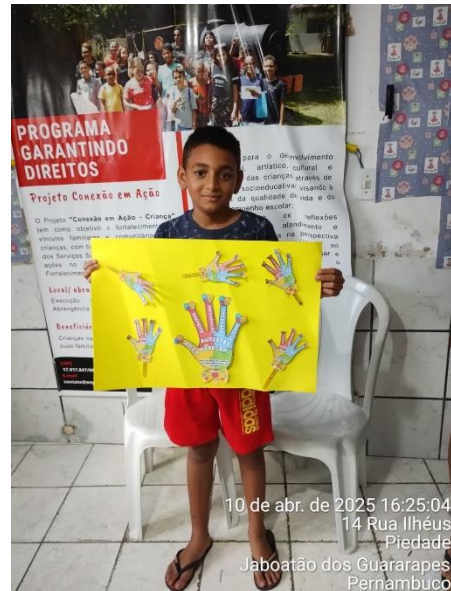
10 de abr. de 2025 16:25:04 14 Rua Ilhéus Piedade Jaboatão dos Guararapes Pernambuco