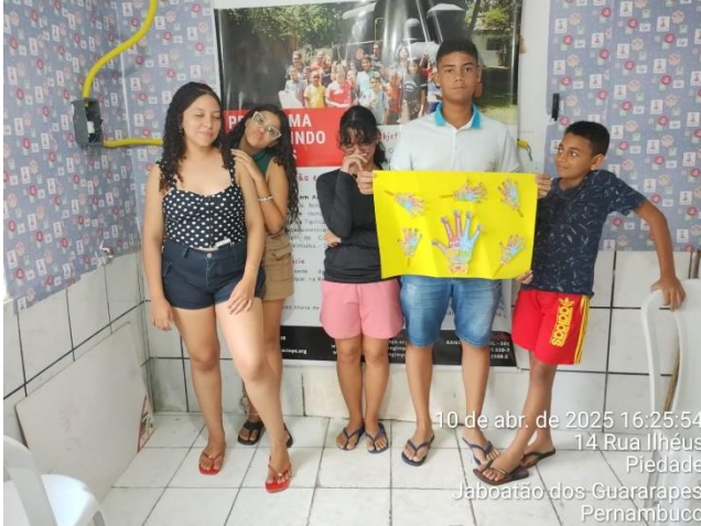
10 de abr. de 2025 16:25:54 14 Rua Ilhéus Piedade Jaboatão dos Guararapes Pernambuco