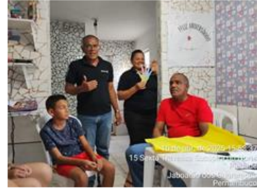
15 Sexta-feira, 11 de maio de 2025 15:56:37 Jaboatão dos Guararapes Pernambuco