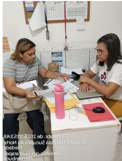
24 de apr. de 2025 10:23:48 14 Sexta Travessa Sucupira do Norte Piedade Jaboatão dos Guararapes Pernambuco