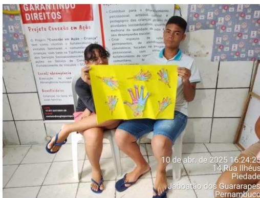
10 de abr. de 2025 16:24:25 14 Rua Ilhéus Piedade Jaboatão dos Guararapes Pernambuco